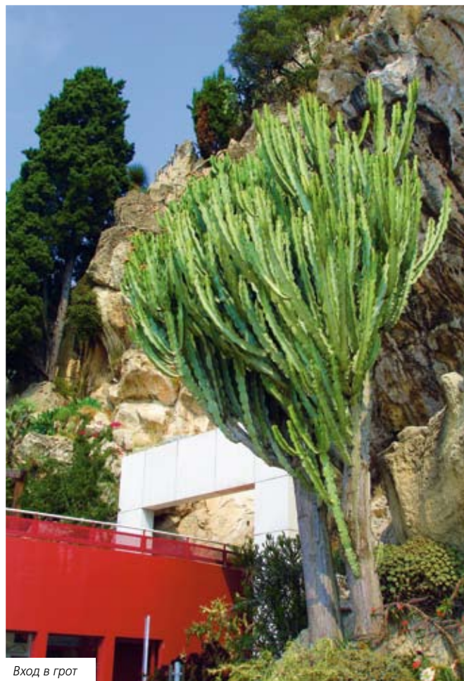
Вход в грот